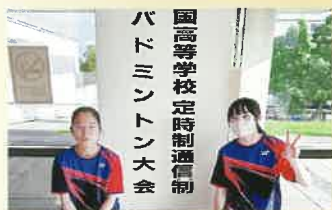
全国定通大会(バドミントン)