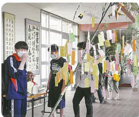
玄関ホール風景（7月7日）