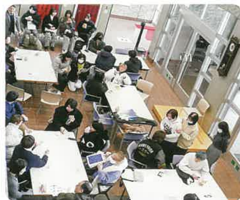
とりよんカフェ（3月）