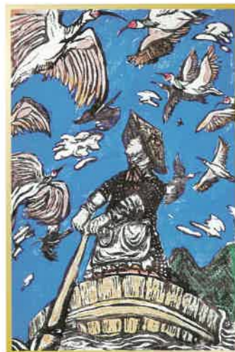
第22回 全国高等学校版画選手権大会 文部科学大臣賞受賞作品 *2