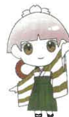
杜陵高校百周年 記念マスコット とりよん