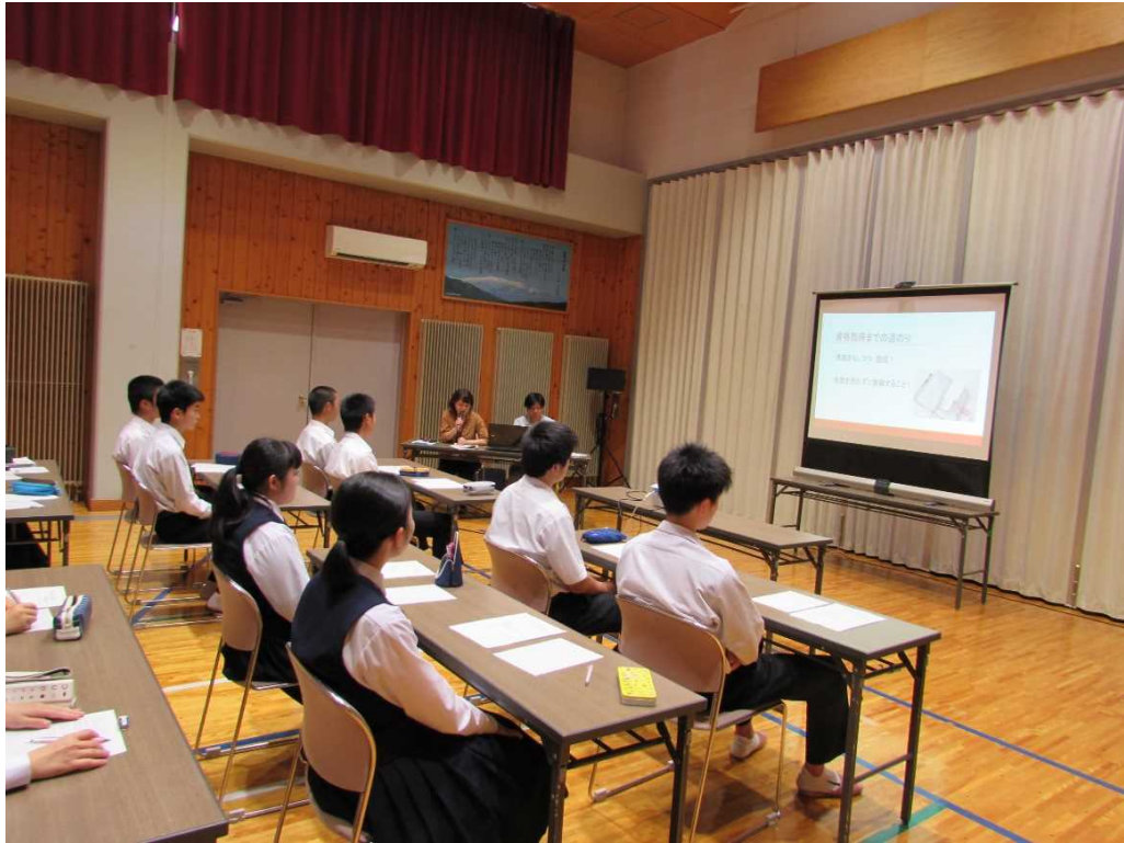
医療・福祉チームは福祉の里で。