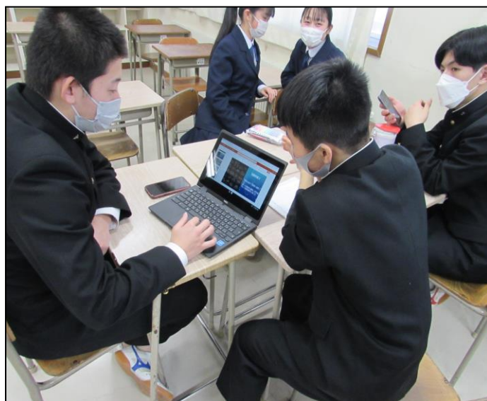
『これからの国際交流』ゼミ