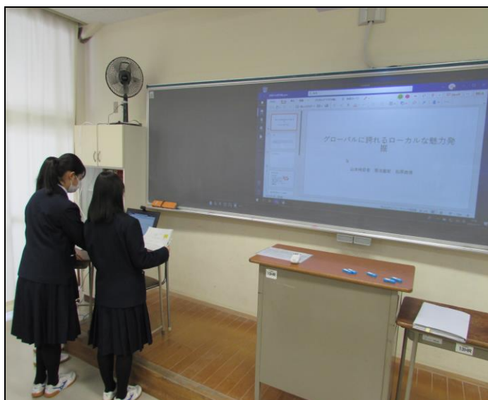
『グローバルに誇れるローカルな魅力発掘』ゼミ