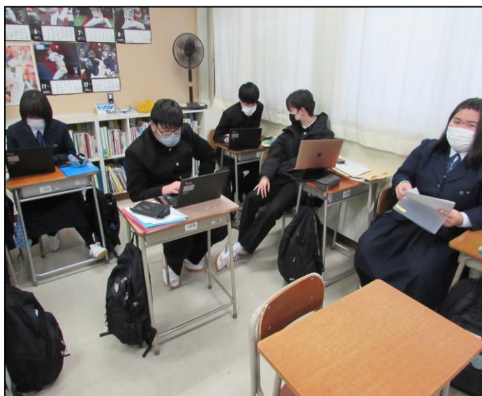
『未来の遠野物語』ゼミ