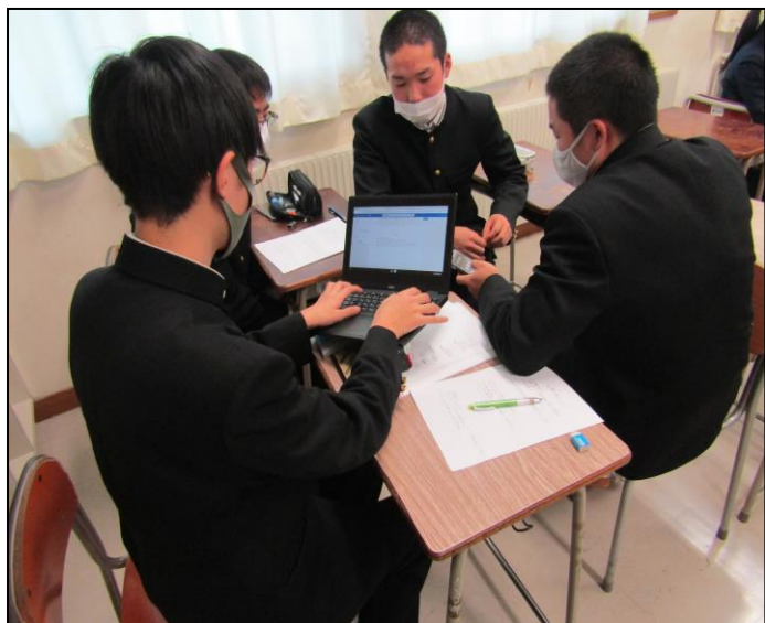
『これからの国際交流』ゼミ