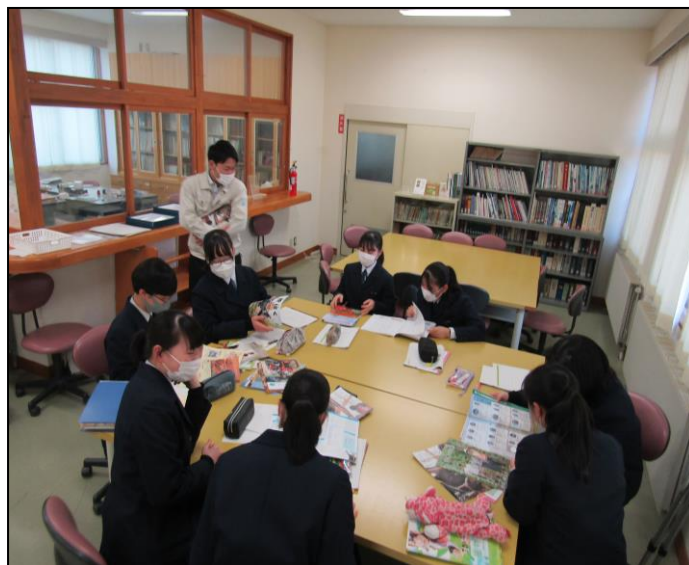
『こども本の森遠野を市民みんなで育てるために』ゼミ