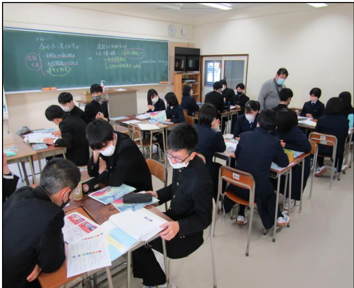
『みんなの未来探究コース』ゼミ