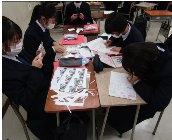
『未来の遠野物語』ゼミ