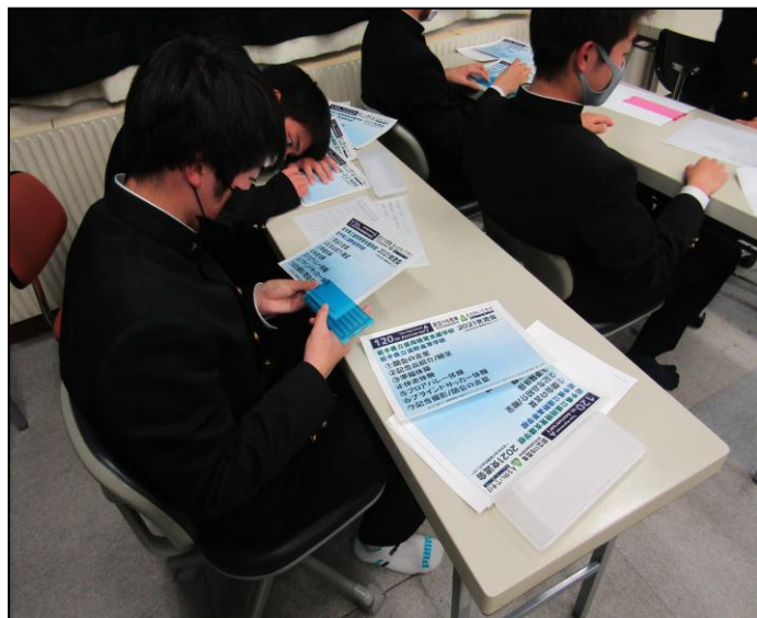
『Tono soccer laboratory 2021』ゼミ