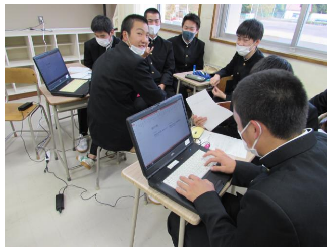
（遠野に生きる人たちの今・昔）ゼミ