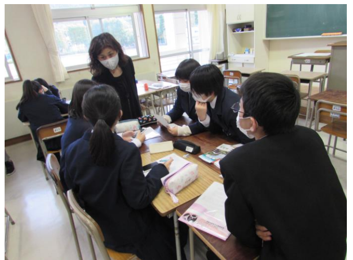
(外国人にやさしいまちづくり) ゼミ