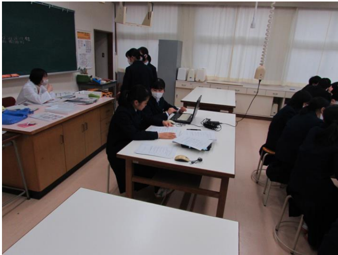
(遠野地域の食生活改善の今・昔) ゼミ