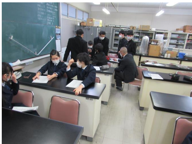
（遠野を自然科学の視点で）ゼミ