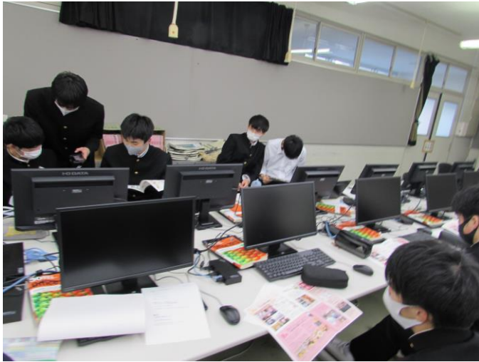
(魅力ある広報) ゼミ