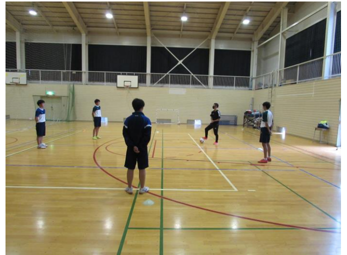
(遠野サッカー研究所) ゼミ