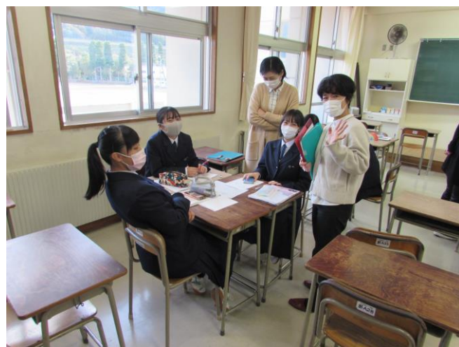
（外国人にやさしいまちづくり）ゼミ