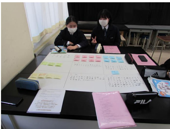
(子ども・子育て推進) ゼミ