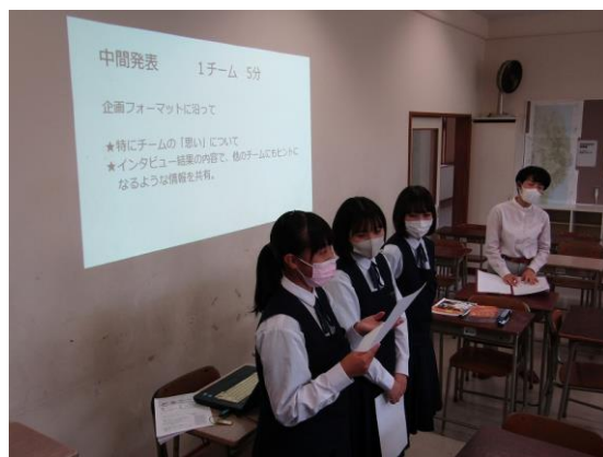
外国人にやさしいまちづくり ゼミ