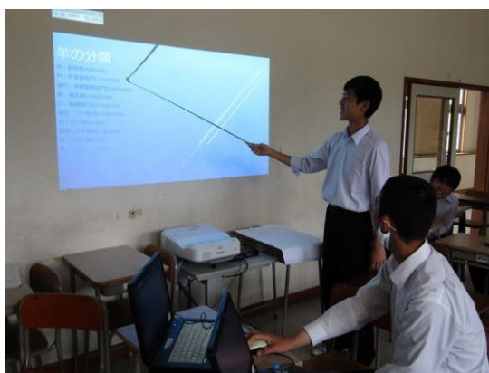
遠野市とジンギスカン ゼミ