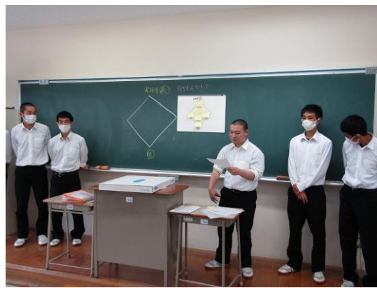
囲碁と私と数学と ゼミ