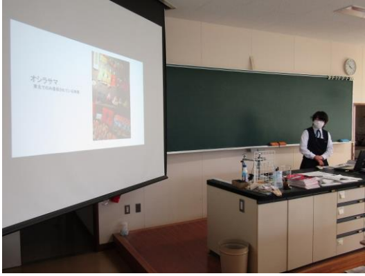
遠野地域の食生活改善 ゼミ