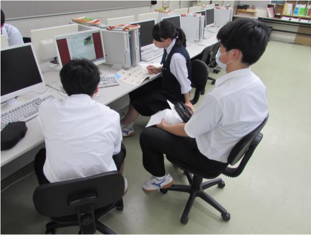
(魅力ある広報) ゼミ