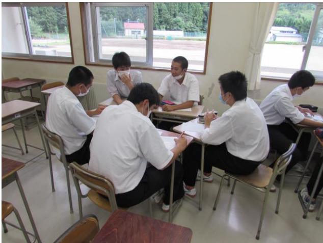
(遠野に生きる人たちの今・昔) ゼミ