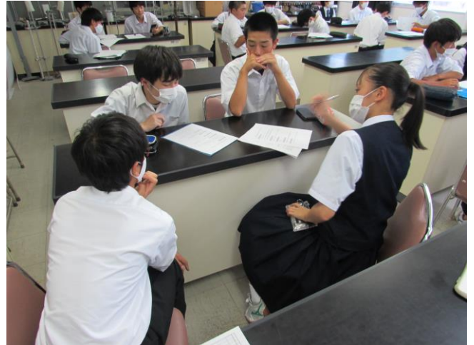
(遠野を自然科学の視点で) ゼミ