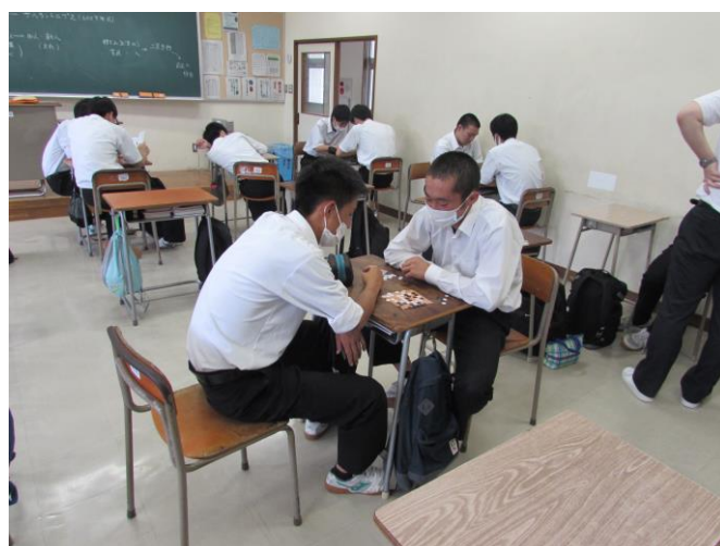
（囲碁と私と数学と）ゼミ