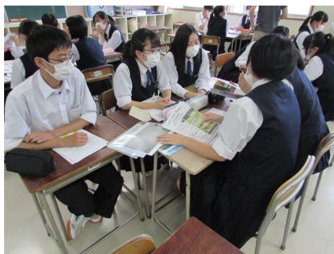
（外国人にやさしいまちづくり）ゼミ