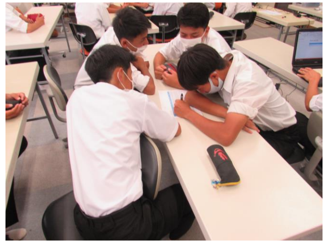
(遠野サッカー研究所) ゼミ