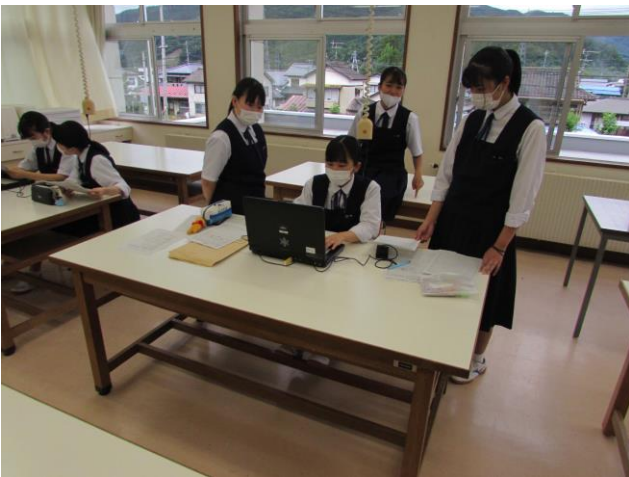
(遠野地域の食生活改善) ゼミ