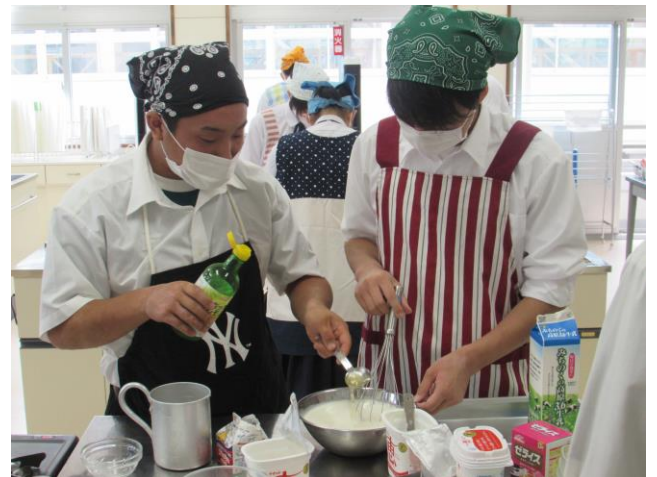
(遠野市とジンギスカン) ゼミ