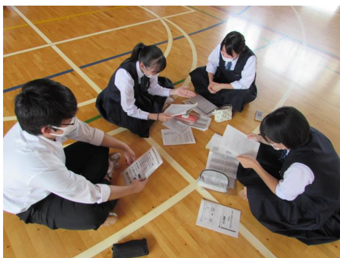
（3年生の探究 第1体育館にて）