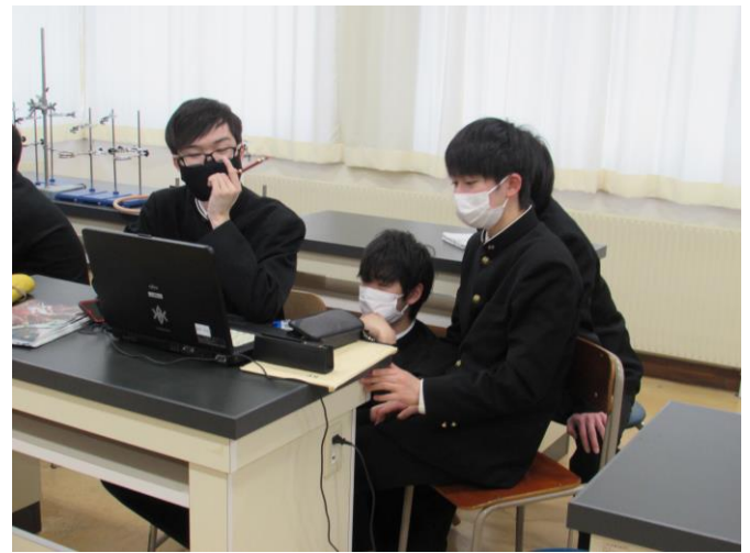
(遠野を自然科学の視点で) ゼミ