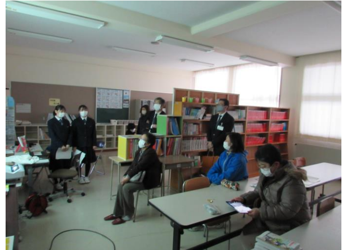
(外国人にやさしいまちづくり)ゼミ