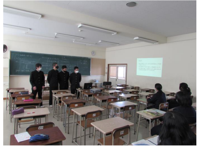
(遠野に生きる人達の今・昔) ゼミ