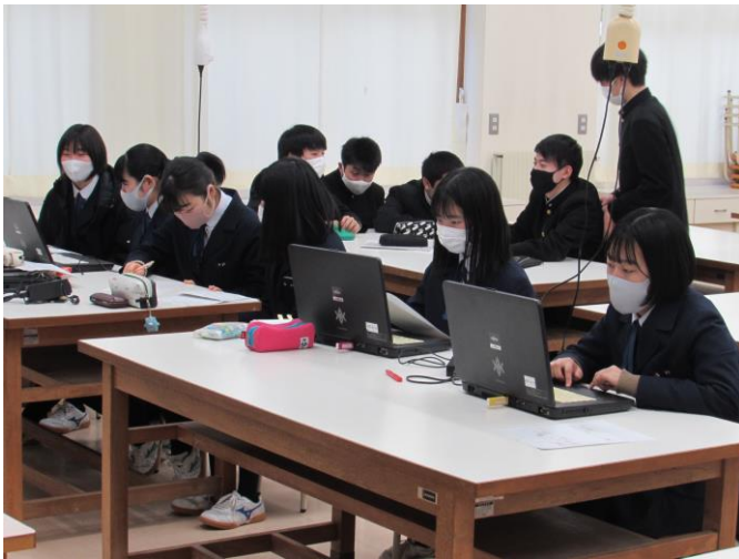
(遠野地域の食生活改善) ゼミ