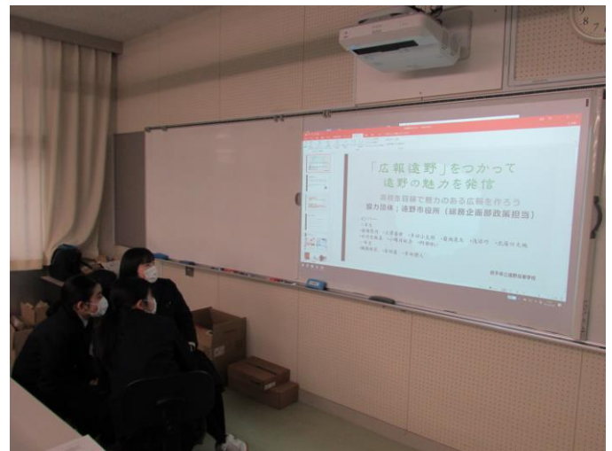
(魅力のある広報を作ろう)ゼミ