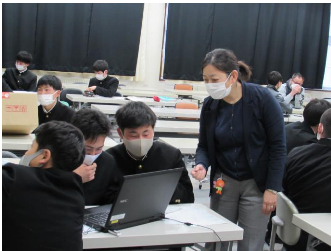
(遠野サッカー研究所)ゼミ