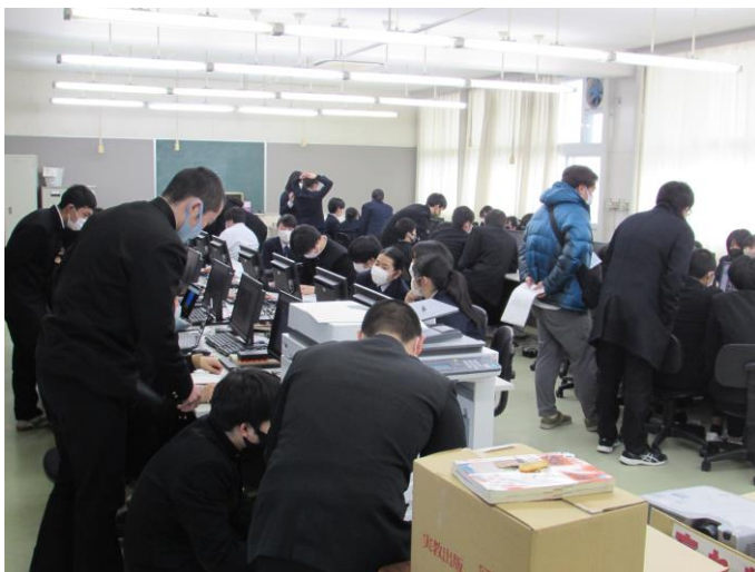
(情報処理室での様子)