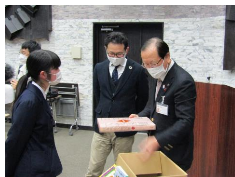
遠野市長への説明