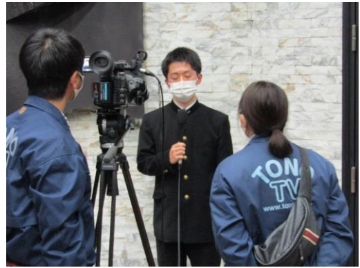
インタビューもありました