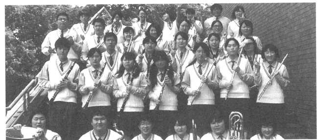
会を目指して頑張ってもらいたいです。

私たち吹奏楽部は、平成25年度全日本吹奏楽コンクール岩手県大会東北地区大会を突破し、地区代表として8年ぶりに岩手県大会に出場することができました。 県大会までの練習では、地区大会の審査委員の先生方からいただいた講評や、顧問の先生や講師の先生に指導していただいたことを必要か、どうすればもっと上手く表現や演奏ができるようになるかを部員みんな で話し合いました。一人一人が話し合いの内容を活かして良い演奏が出来るように練習を頑張った結果、県大会で金賞をいただくことができました。 ステージで賞状を受け取ったとき、部員全員で県大会金賞という目標に向かって練習し、その目標をクリアしたんだという達成感と満足感が胸がいっぱいになりました。来年のコンクールでも後輩たちには高い目標を持って、もっと上の大