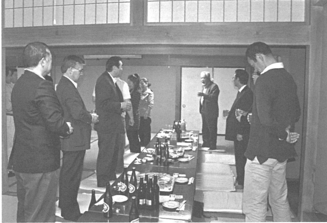
総会の様子 (なかの食堂にて)