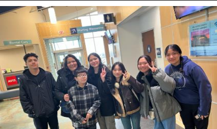
ホストファミリーとの最後の別れ