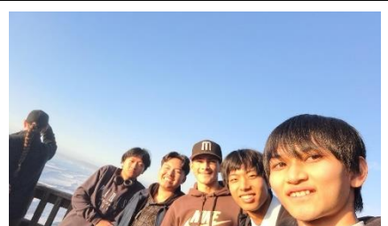
ホストファミリーとのピクニック