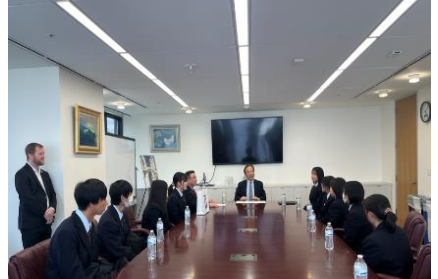
サンフランシスコ総領事館表敬訪問