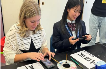
デルノーテ高校での授業風景