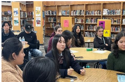
デルノーテ高校での授業風景