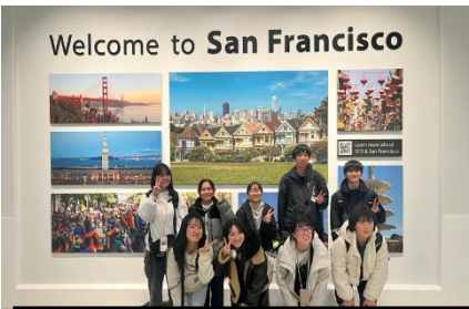
無事にサンフランシスコ到着

新年が明けてすぐの一月五日（月）午後一時、高田高校の生徒九名と引率教員二名、市役所職員一名の計十二名が、アメリカカリフォルニア州クレストシティにむけて、陸前高田市を出発しました。生徒はこの研修に向けて、毎週火曜日に陸前高田市職員による英会話教室に参加し、英語コミュニケーション能力向上に努めてきました。 初めて触れる異国文化、緊張と不安のホームステイ生活、参加した生徒にとつて、アメリカでのすべての体験がかけがえのないものとなりました。 テルノーテ高校にお世話になった三日間もあつという間に終わりを告げた日、涙を流し別れを惜しむ生徒の姿が多く見られました。改めて国際交流の意義や重要性を感じる事ができた交流事業になったと思えます。 この交流は、陸前高田市の多大な支援によって実施されています。本当にありがとうございました。 二月二十四日（土）午後一時三十分には市民向け報告会を陸前高田市コミューニティホールで開催します。多くの方々のご来場をお待ちしております。