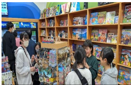
ハワイの空港で買い物中