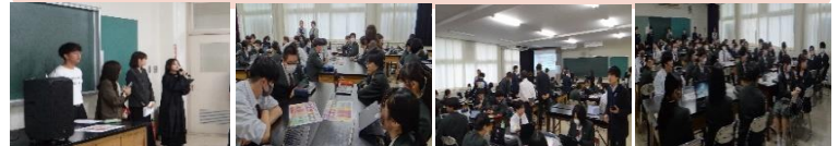
R7.10.20(月) 若者が政治や社会課題に対して主体的に考える力を育むことを目的に、「虹色コンパス 主権者意識向上カリキュラム」を実施しました。