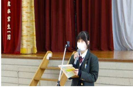
生徒会長歓迎の言葉

入学式翌日、対面式と新入生オリエンテーションが行われました。新入生は初めて先輩と対面し、その後、一人ひとりで自己紹介を行いました。聾高の対面式の良いところは何と言っても先輩たちが優しく温かいところです。緊張の面持ちで自己紹介を終えた新入生に温かい拍手とエールを送りました。対面式後はオリエンテーションとして、行事や生徒会、実演を交えた各部の紹介が行われました。