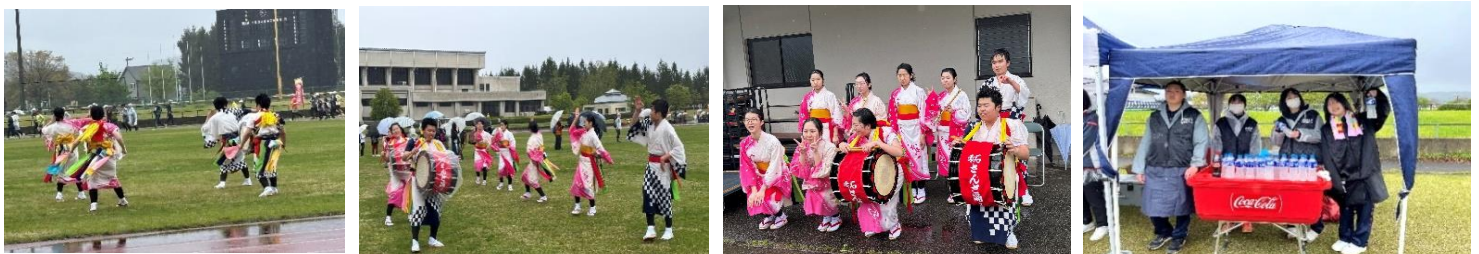
郷土芸能委員会による、スタート・ゴール地点での激励を込めた演舞