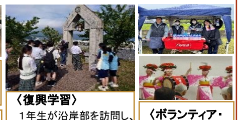
〈復興学習〉 1年生が沿岸部を訪問し、復興学習を実施。山田高校との交流。