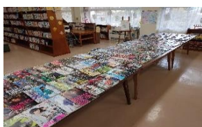
図書・視聴覚委員の企画