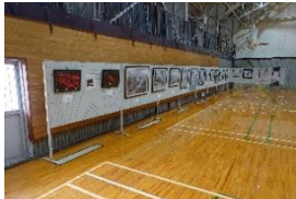
雫石町芸術文化協会の皆さまの水墨画展示・合唱