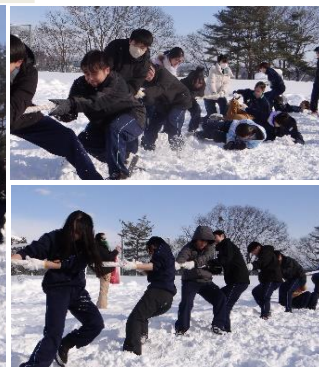
大いに盛り上がった綱引き 保護者の皆さんも出場しました