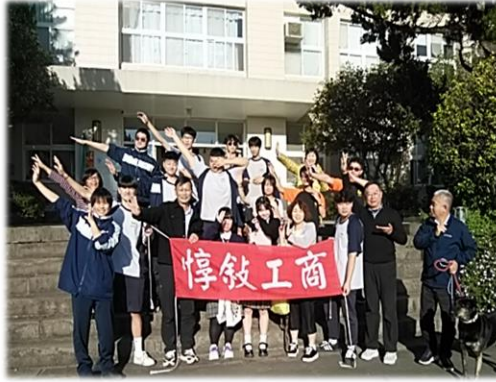
今年度は新たに惇叙工商高校とも交流