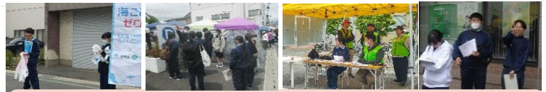
R7.6.1(日) 軽トラ市に参加させていただき、「海ゴミゼロプロジェクト」、「選挙啓発活動」、「軽トラ市全体運営補助」、「軽トラ市アンケート調査」を行いました。