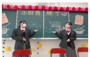
2・3年生は模擬店を開きました