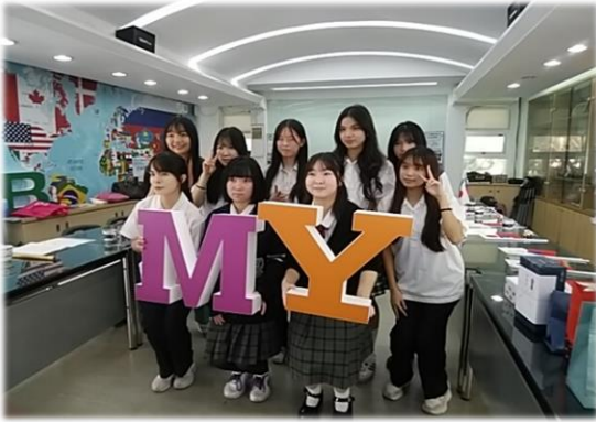
毎年交流している陽明高校