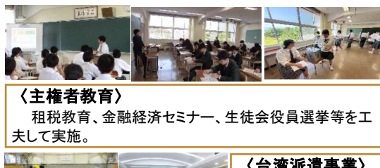
〈主権者教育〉 租税教育、金融経済セミナー、生徒会役員選挙等を工夫して実施。