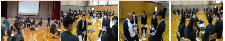
R7.11.10(月) 「なぜ学ぶのか」「なぜ働くのか」という根源的な問いに向き合い、答えを深めることを目的とした企画「『ソクラテスマーティング』を開催しました。