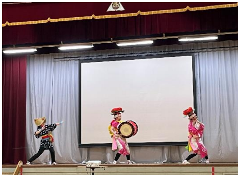
郷土芸能委員会紹介