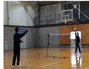
バドミントン部紹介