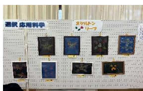
応用科学選択生の作品展示

10月25日(土)は、思郷祭(文化祭)の一般公開日でした。多くの皆様にご来場いただき、生徒たちが日頃の学習や委員会活動で積み重ねてきた成果をご覧いただくことができました。模擬店も大盛況で、笑顔と活気に満ちた一日となりました。ご来場いただいた皆さま、誠にありがとうございました。今年は、「しずくちゃん」と「ケキヨきち」も来校し、会場を一層盛り上げてくれました。さらに、雫石町芸術文化協会の皆さまによる水墨画や菊の展示、そして心に響く合唱が加わり、文化祭に華やかな彩りを添えていただきました。