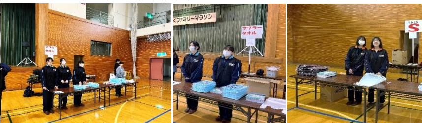
選手受付係として、選手のみなさんが力を発揮できるよう、笑顔で頑張りました

雫石町営陸上競技場を発着とした特設コースで開催された、第41回岩手山ろくファミリーマラソンに10名の生徒がボランティアとして参加、また郷土芸能委員会9名が陸上競技場で演舞を披露させていただきました。ご指導いただいた運営の皆さんに感謝いたします。