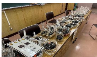
毎年好評の松ぼっくり販売