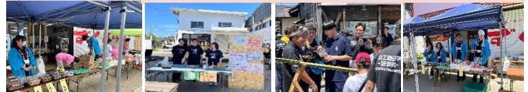
R7.7.13(日) 7月の軽トラ市においては、13の店舗様にお世話いただき、販売促進に対する取り組みを学ばせていただきました。