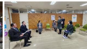
出発前に町長様・教育長様へご挨拶をさせていただきました