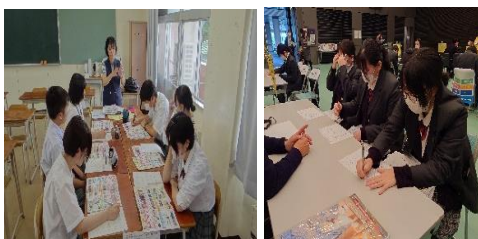
〈進路ガイダンス〉 対話をとおして職業観や人生観を醸成。