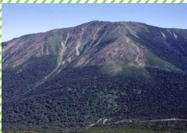
日本百名山 早池峰山

ぶどう栽培が盛んに行われ、県内有数のぶどう産地であり「ワインのまち」としても有名で、株式会社エーデルワインは、国内外のワインコンクールで数々の賞を受賞するワインを醸造しています。