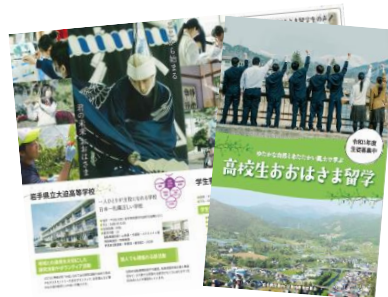
↑ 留学生募集パンフレット