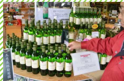
ぶどう・ワイン産業が盛ん!