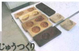
雛まんじゅうづくり