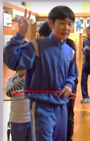
じゃんけんかもつれっしゃ