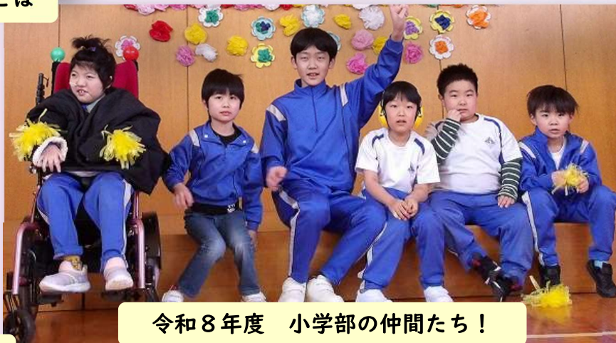
令和8年度 小学部の仲間たち！