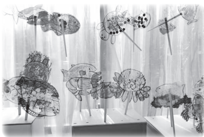
「はくぶつかんで みつけた うみ」