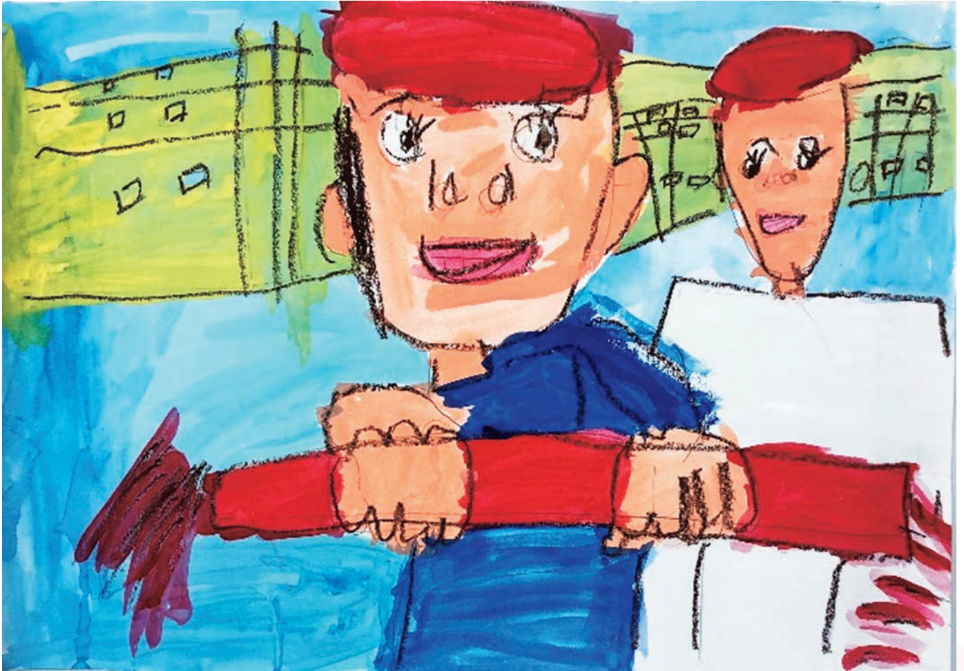
「友情リレー 中学部のおにいさんと」