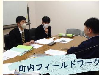
町内フィールドワーク