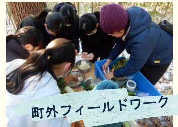
町外フィールドワーク