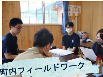
町内フィールドワーク

フィールドワーク先 ※敬称略・順不同 ・三陸自然学校大槌 ・つつみこども園 ・吉里吉里公民館 ・株式会社松橋自動車 ・MOMIJI株式会社 ・植田医院 ・大槌町役場 ・大槌町立図書館 ・さとり株式会社 ・NPO法人吉里吉里国 ・花道プロジェクト ・training gym KING8 など