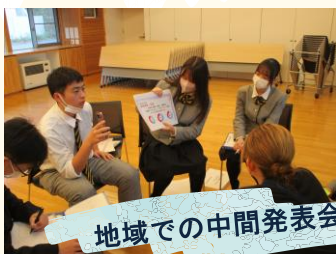
地域での中間発表会