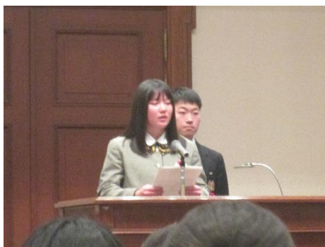
発表会の様子です。