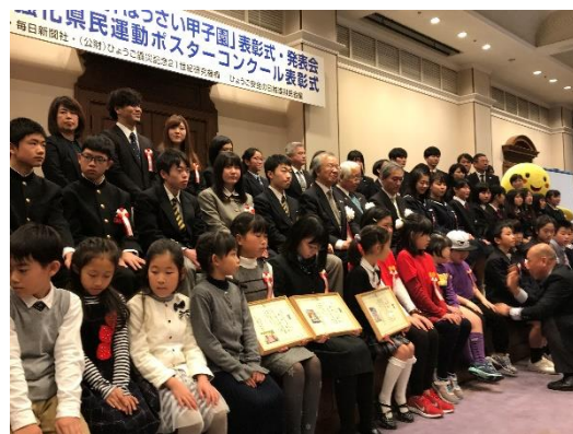
参加者全員で記念撮影をしました。