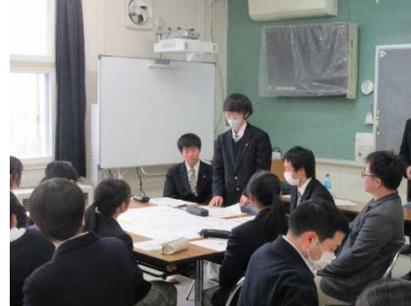
魅力化のためにできることを各グループから発表