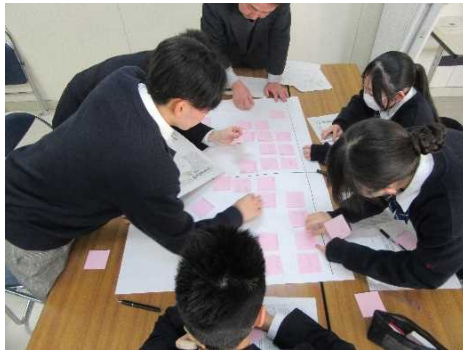
意見を付箋に書き貼っていく