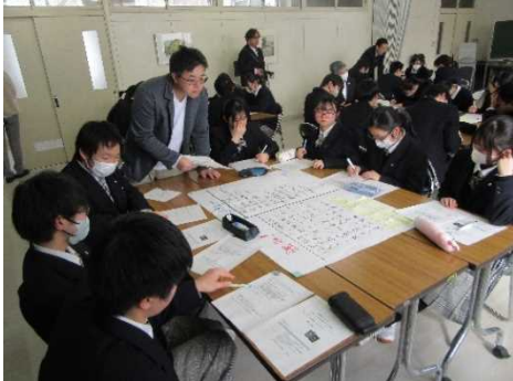
進行役のもと話し合い

<2月21日>前回の意見を元にし、「高校を魅力化するアイデアや改善策」や「魅力化のためにできること」等を各自のワークシートに記載の後、グループ毎に話し合いました。