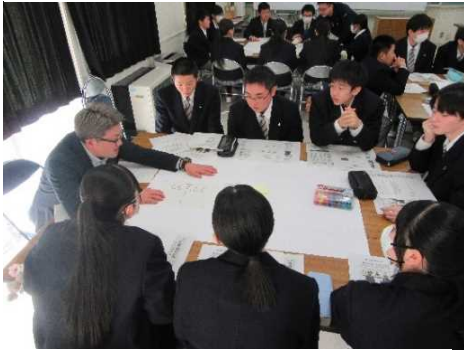
進行役のもと意見を出し合う

<1月31日>生徒(1・2年生)は5つのグループに分かれ、「大野高校の強みと弱み」をテーマに様々な意見を出し合いました。