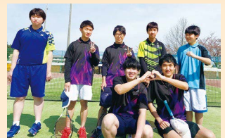
男女ソフトテニス部