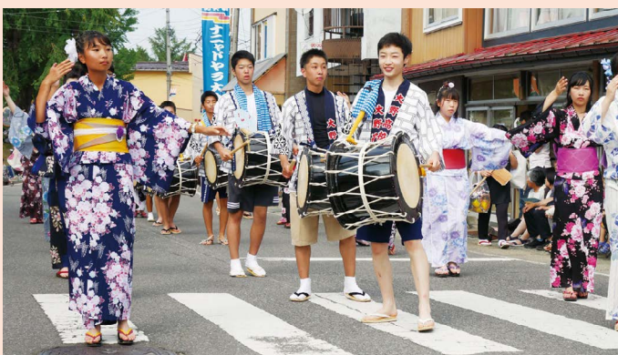
ナニヤドヤラ大会