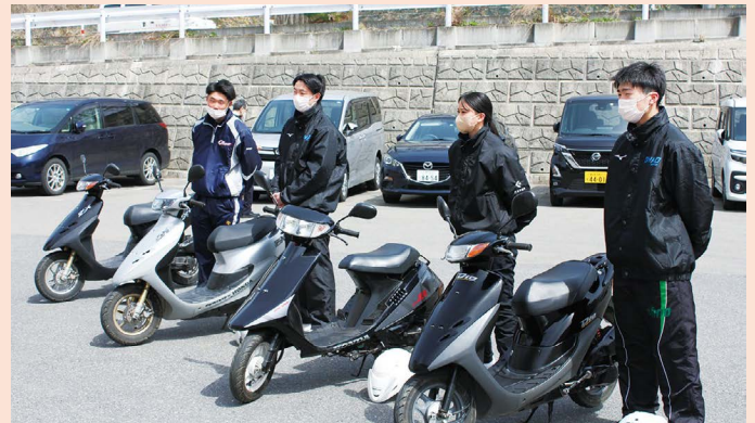
交通安全実技講習会