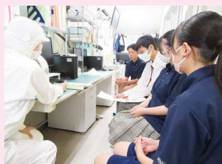
パン工房との打ち合わせ