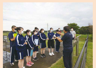
フィールドワーク