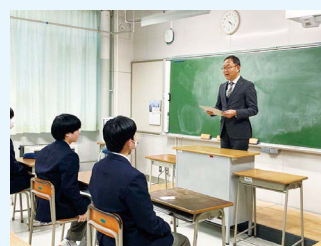
共通テスト激励会