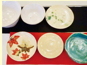
総合文化祭の工芸作品展示

大野地域は木工産業が盛んで、大野高校では「工芸」を学ぶことができます。高校近くの「産業デザインセンター」の御協力のもと、木工をはじめとした陶芸やさき織りなどの学習ができます。作品は、大野高祭や洋野町文化祭、久慈地区高等学校総合文化祭などで展示されます。