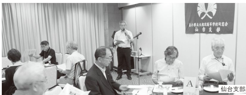
仙台支部総会の様子