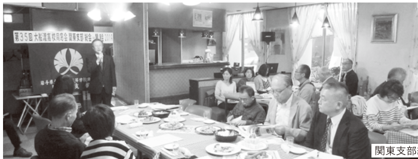
関東支部総会の様子

今年度も各支部において支部総会が開催されました。関東支部総会は、当所予定していた開催日に台風19号の直撃を受け約1ヶ月遅れの実施となりました。それでも多くの会員が集まり、東京の地から母校の創立70周年を祝いました。関東支部長からは、盛大に挙行された「創立70周年記念式典」等の報告があり、参加者一人ひとりからは、自己紹介も兼ねた近況が報告され懇親の輪を広げることができました。事務局からは、震災当時の学校の状況等、70周年記念事業の取り組み、現在の教育活動等を紹介しました。