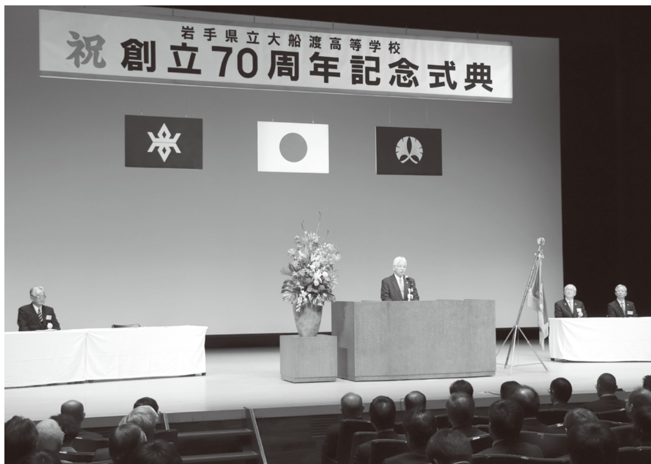
創立70周年記念式典の様子