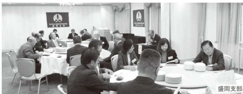
盛岡支部総会の様子