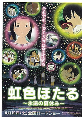
(c)川口雅幸/アルファポリス・東映アニメーション