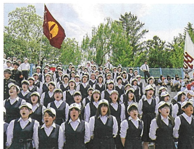
5月26日 高総体開会式