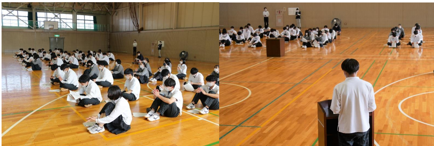
委員長、部長の報告や後期活動方針