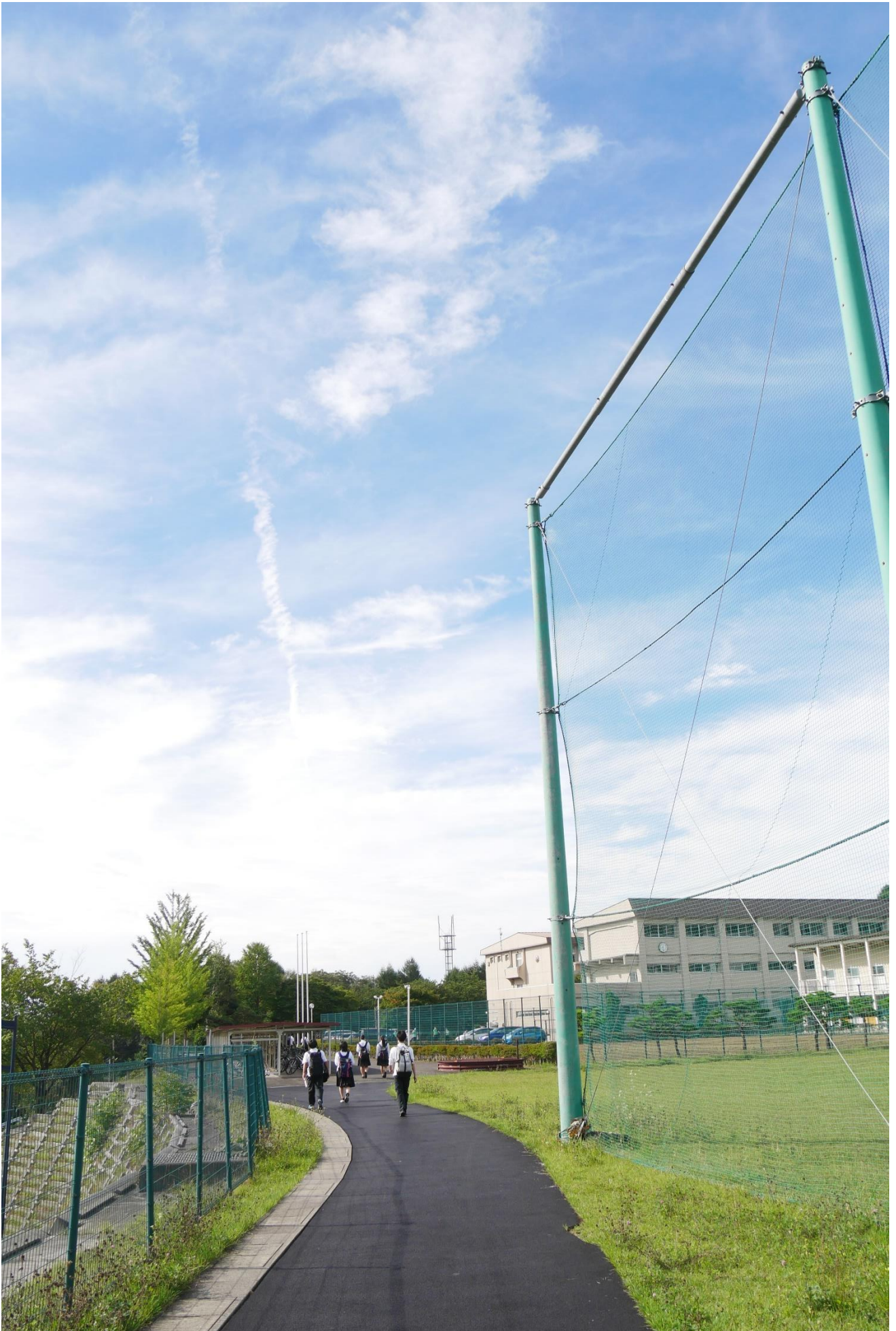
<沼宮内高校HP管理運営委員会>