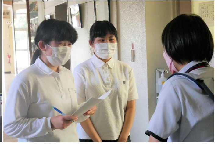
取材結果と考えをまとめます。