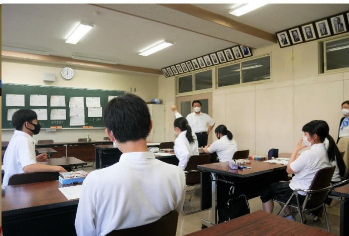
順番決めのじゃんけん