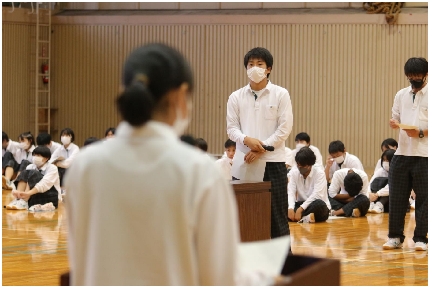
全ての議案を拍手で承認