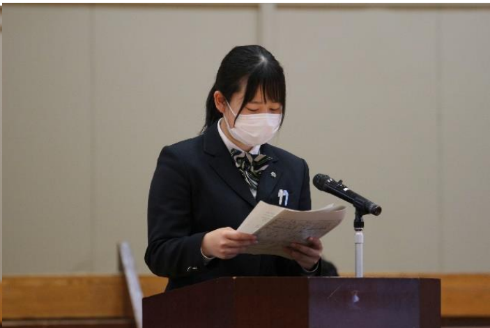
生徒からの質問と丁寧な回答