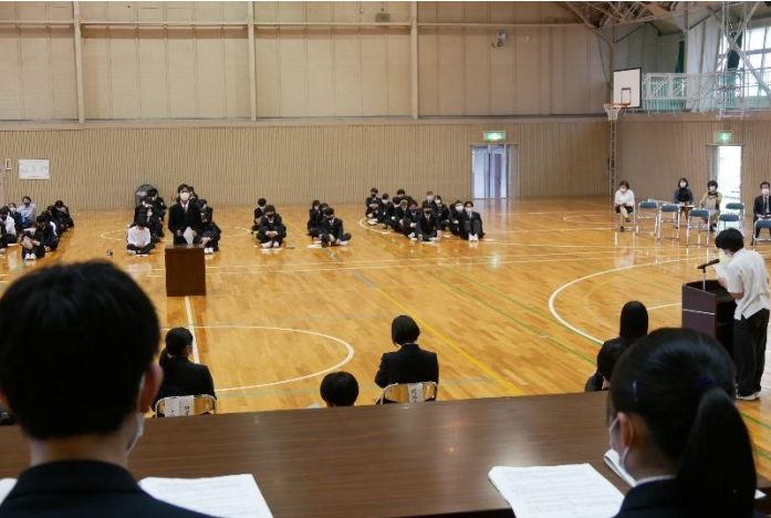
生徒会から予算、決算