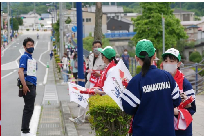
記念品をたくさん頂きました。ありがとうございます。