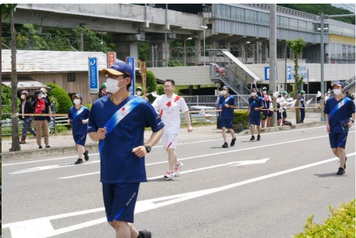
約30分間の応援でした。