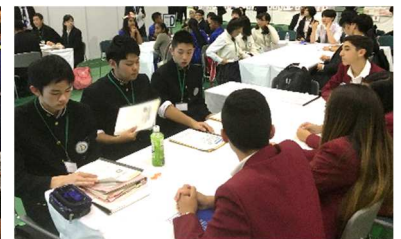
<ディスカッション>