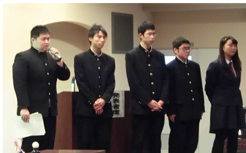
質問に回答する出前授業班メンバー