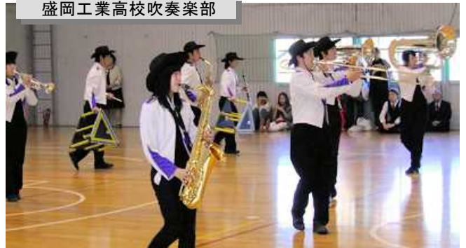
盛岡工業高校吹奏楽部

その後、図書館に場所を移し、両校の生徒会役員たちで交流会を開催しました。本校の生徒たちは「盛工」の文化に触れ、大いに刺激を受けるとともに、本校生徒会が取り組んでいる「震災を風化させない」活動などについて、盛工生徒会に紹介することができました。