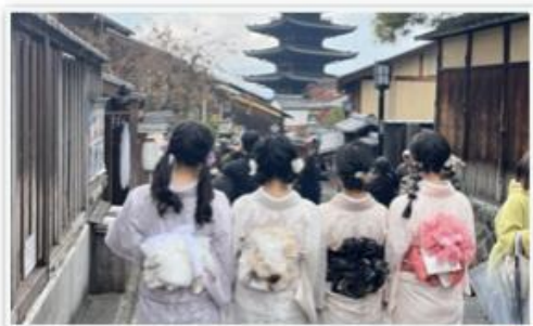
2 学年 修学旅行