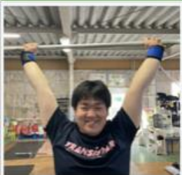
ウェイトリフティング