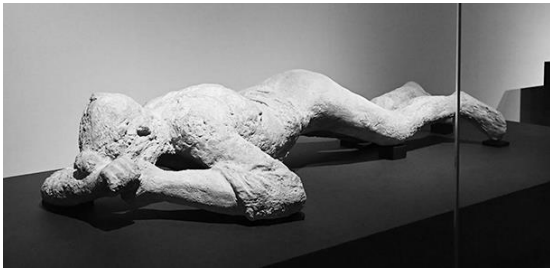
↑ うつ伏せで亡くなった遺体の石膏像