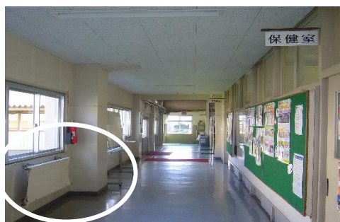
担架① (1階 保健室前の廊下)