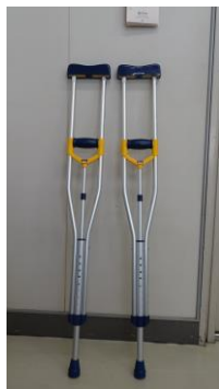
松葉づえ (保健室内)