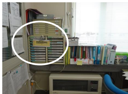
緊急時持ち出し用かご (保健室入口付近)