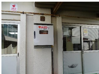
A E D (第二体育館渡り廊下出入口)