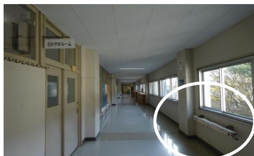
担架② (2階 さわやかルーム前の廊下)