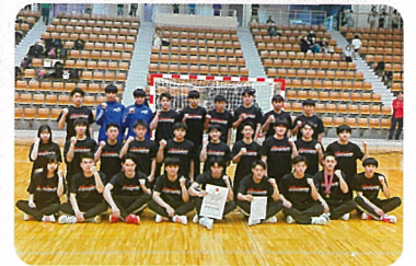
ハンドボール部 男子