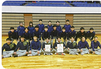
バレーボール部 男子