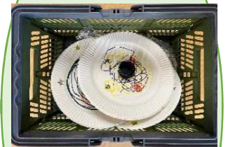
手作りこま、あそびシールカード