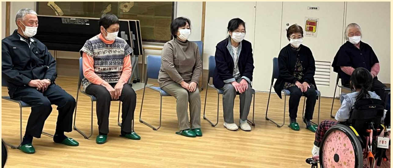
昨年度に引き続き、今年度は11月においでいただきました。

おたがいに、あそぶグッズと「げんき！」持ち寄りました。ちょっぴり緊張のスタート。でも始めれば、緊張はどこかに吹っ飛び、みんなあそびに興味深々・集中の時間となりました。