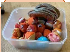
お手玉(大と小)、あやとり めんこ