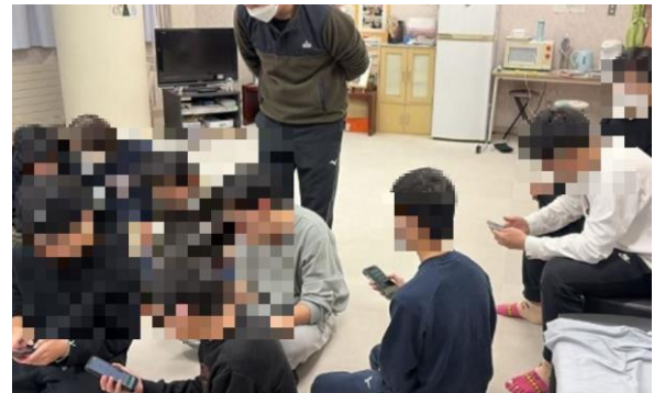
本当に怖いロマンス詐欺講座