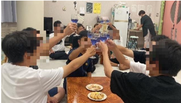
接客業に学ぶイケてるトーク講座