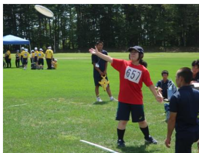
フライングディスク：遠くを狙って