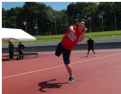
ソフトボール投げ：気合いの一投