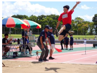
走り幅跳び：より遠くへ