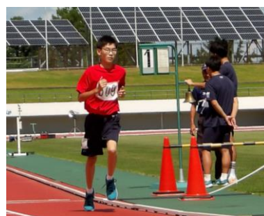
800m：ゴールに向かって