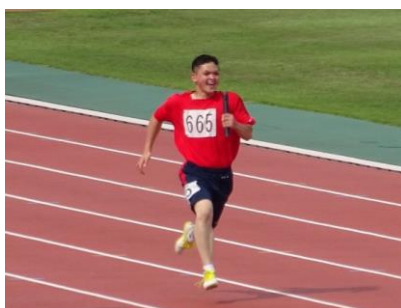
4×100m リレー：バトンを繋いで