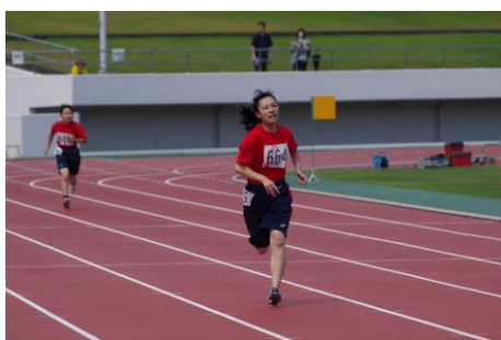
200m：スピードに乗って！