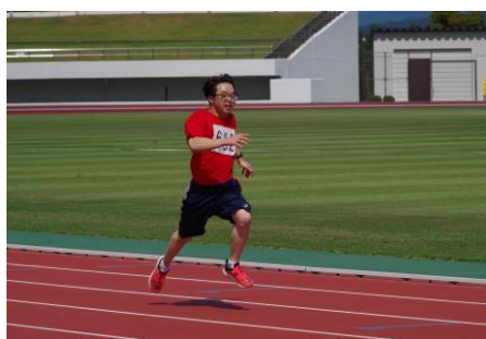
100m：力強く駆け抜けて！

交流大会当日は、生徒一人ひとりが出場種目に全力で挑戦し、力の限り、持てる力を発揮することができました。また、他校との交流を深めることができました。仲間に精一杯応援をして、お互いの頑張りを称え合うことができました。