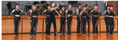
バントワリング部