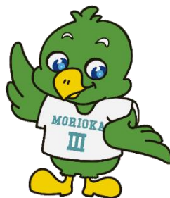
三高マスコット「トナンくん」