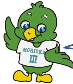
三高マスコット「トナンくん」