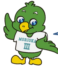
三高マスコット「トナンくん」