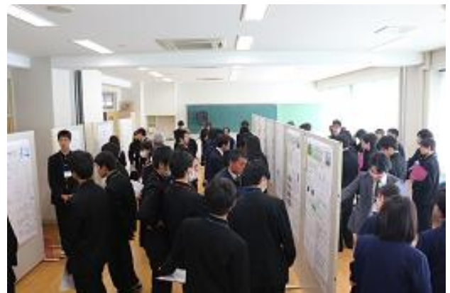
化学・生物・数学会場の様子②