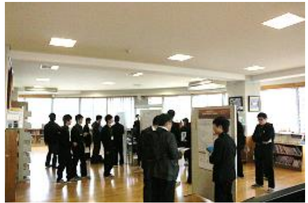
物理・地学会場の様子①