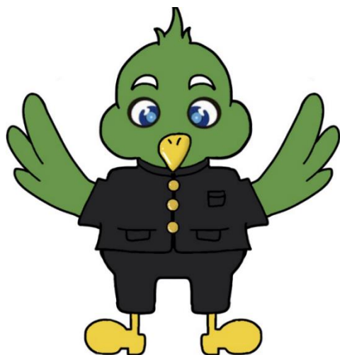
盛岡三高マスコットキャラクター「トナンくん」