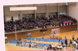
ハンドボール全校応援