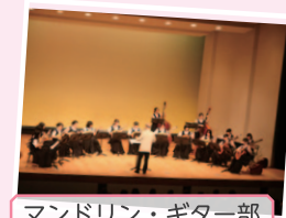
マンドリン・ギター部