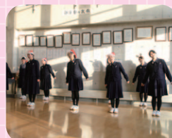
クリスマス・コンサート