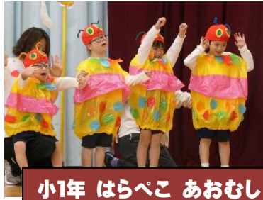
小1年 はらべこ あおむし

今年度は、保護者・一般来場者ともに人数制限をせずに約230名の来場がありました。児童生徒は日頃の学習や練習の成果を存分に発揮し、大成功のステージ発表となりました。