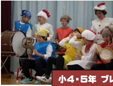
小4・5年 プレーメンの音楽隊