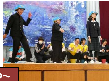
中学部 COSMOS~ぼくらはひとつ~