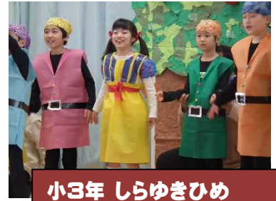
小3年 しらゆきひめ