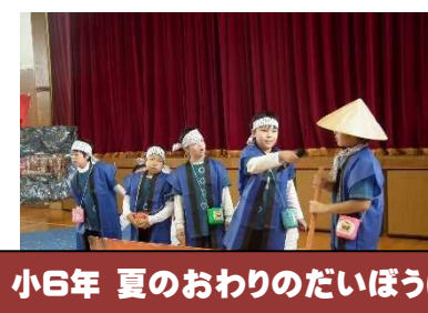
小6年 夏のおわりのだいぼうけん