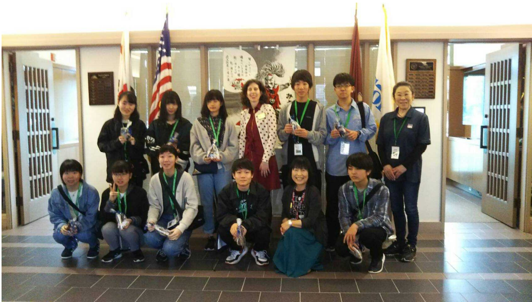
Meet the Mayor at Concord City Hall (March 29, 2019)

派遣先：カリフォルニア州コンコード 派遣期間：2019年3月27日(水)～4月3日(水)