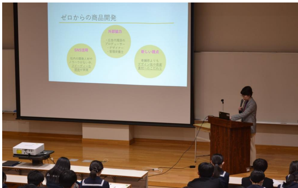
商品開発の心得を発表いただきました

後半は、商品開発ワークを行いました。「新しい商品を開発する」か「既存商品の改良を行う」かをテーマに、グループごとにアイデアを出し合いました。発表では、「顔パック商品の開発」や「豆腐に合う醤油」といったユニークなアイデアが飛び出し、それぞれにターゲット層やキャッチコピーも考えられており、生徒たちの工夫と発想の豊かさが感じられる内容でした。