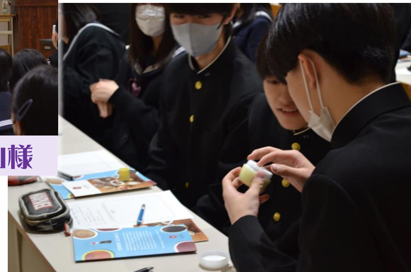
商品の一つであるクリーム を手に取る生徒