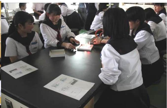
↑ 化学「炎色反応」体験授業の様子