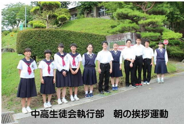
中高生徒会執行部 朝の挨拶運動

その後、分科会と全体会が行われ、軽中・軽高の全教員が集まり、同じ教科や部活動などの単位で情報交換しながら、よりよい中高一貫教育の在り方について話し合いました。