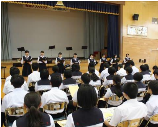
↑ 音楽部発表の様子（全体会）